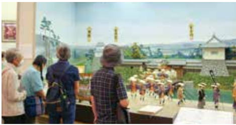
新庄ふるさと歴史センター