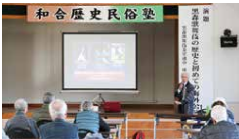
黒森歌舞伎の歴史について

和合歴史民俗塾は、妻が私より先に受講しており、私は仕事の関係で専ら妻の運転手で和合の里へ送迎していました。その後、仕事も一段落し、妻が真面目に受講している和合歴史民俗塾に自分も受講し始めました。ただ一つの懸念は、受講日程と自らの日程をどう調整するかでした。ですから受講時の資料等に次回の日程を見て、医院等の予約日と重なっていないかが毎回気がかりでした。最近は重なったときは、医院の予約を変更するようにしています。庄内地方に70年以上住んでいるにもかかわらず、こういう伝統行事が身近にあったのかと驚くとともに、知ってはいても、自分では直接触れ合うことができなかったものも多く、大変興味深く受講していました。今後もぜひ知らない世界への誘いをお願いします。